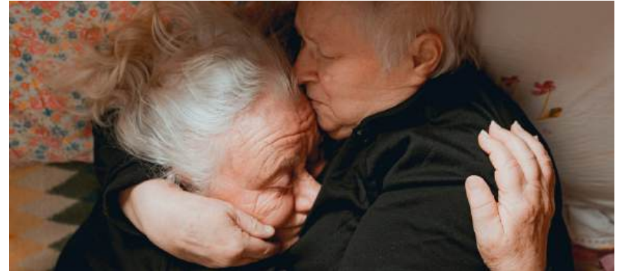
If I Die, It'll Be of Joy

In januari openen we het seizoen met Made in Ethiopia , waarin drie vrouwen centraal staan die hun hoop vestigen op de uitbreiding van China's grootste industriezone op het Ethiopisch plateau, en hun geloof in industrialisatie op de proef gesteld zien. In februari was het de beurt aan een film van eigen bodem: De Heilige Drie-eenheid van Martijn van de Griendt, een liefdevol portret van jongeren die omgaan met onzekerheden, eenzaamheid, vriendschap en liefde. In maart vertoonden we Manas van de Braziliaanse regisseur Marianna Brennand, haar bekroonde speelfilmdebuut over een dertienjarig meisje op het afgelegen eiland Marajó in het Amazonegebied. Na meer dan tien jaar