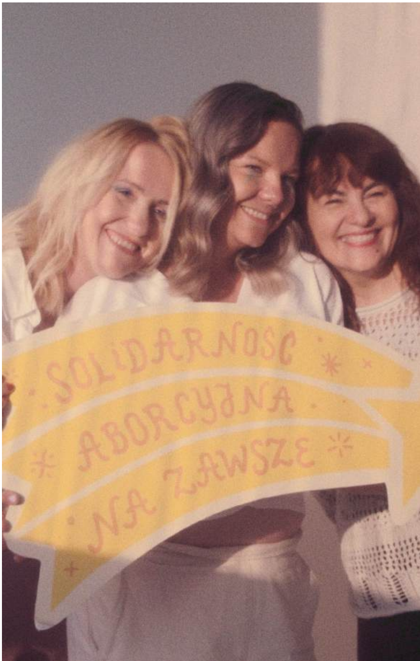
Abortion Dream Team