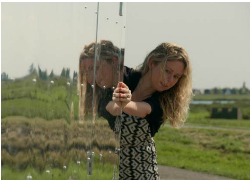
Blauwe ballen en andere verkrachtingsmythes

Het bestuur is verantwoordelijk voor het naleven van de Governance Code Cultuur en de verankering in de organisatie. De RvT houdt toezicht op de naleving van de Code en evalueert dit één keer per jaar.